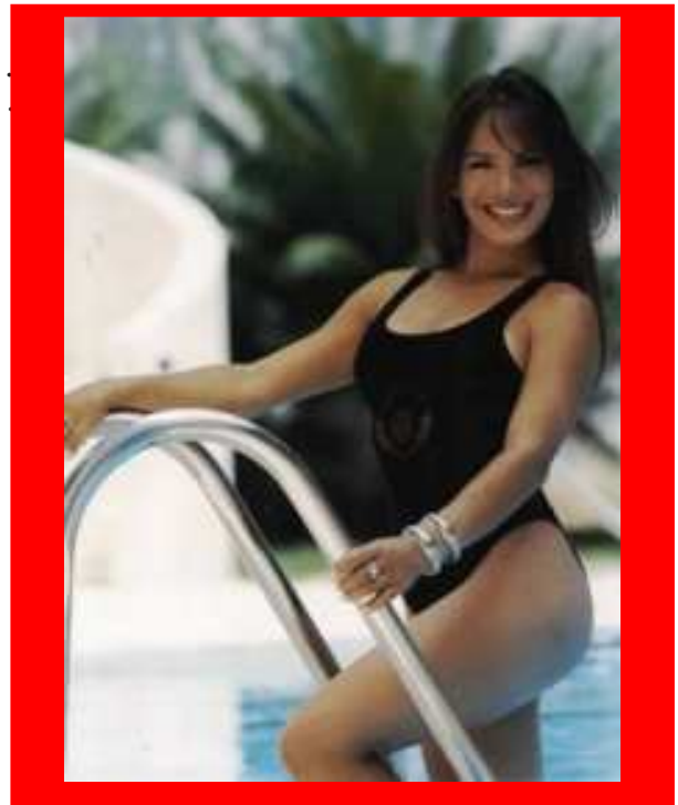
Milka Duno (Foto Superior) la bella venezolana corredora de carros en los Estados Unidos ha impresionado por su destreza al volante en las pistas internacionales y su exuberante belleza.