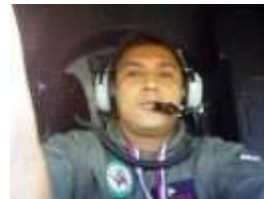
(EXTRACTOS DE LA CARTA)