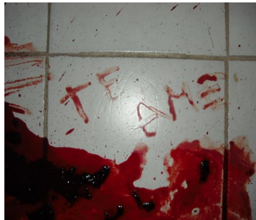
Palabras escritas con sangre supuestamente por la madre de la pretendida víctima para despistar