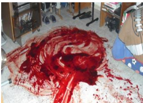
A pesar del reguero de sangre; no se observa desorden en el cuarto de la supuesta víctima