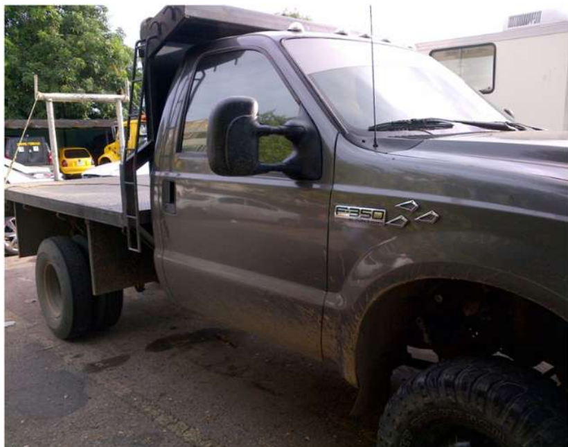
VEHÍCULO UTILIZADO PARA TRASLADAR LO ROBADO