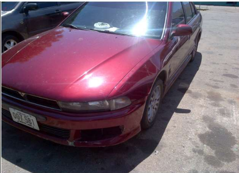
VEHÍCULO UTILIZADO PARA HUIR DEL SITIO DEL SUCESO