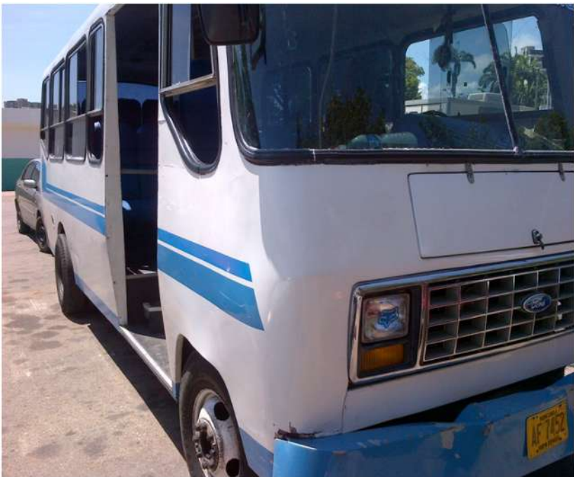
VEHÍCULO UTILIZADO PARA TRASLADAR LO ROBADO