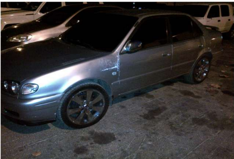
VEHÍCULO UTILIZADO PARA HUIR DEL SITIO DEL SUCESO